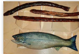
Fischrepliken für Museumsauslage