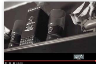
Set-Design für Musik-Video