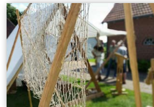
Einrichtung eines Museumsdorfes