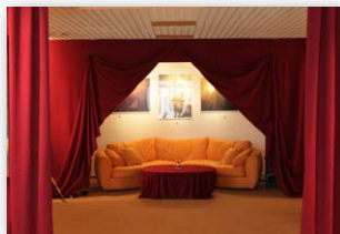
Raumgestaltung mit Stoffen