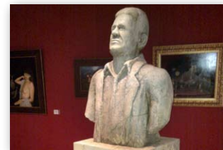
„Marmor“-Büste für Filmproduktion